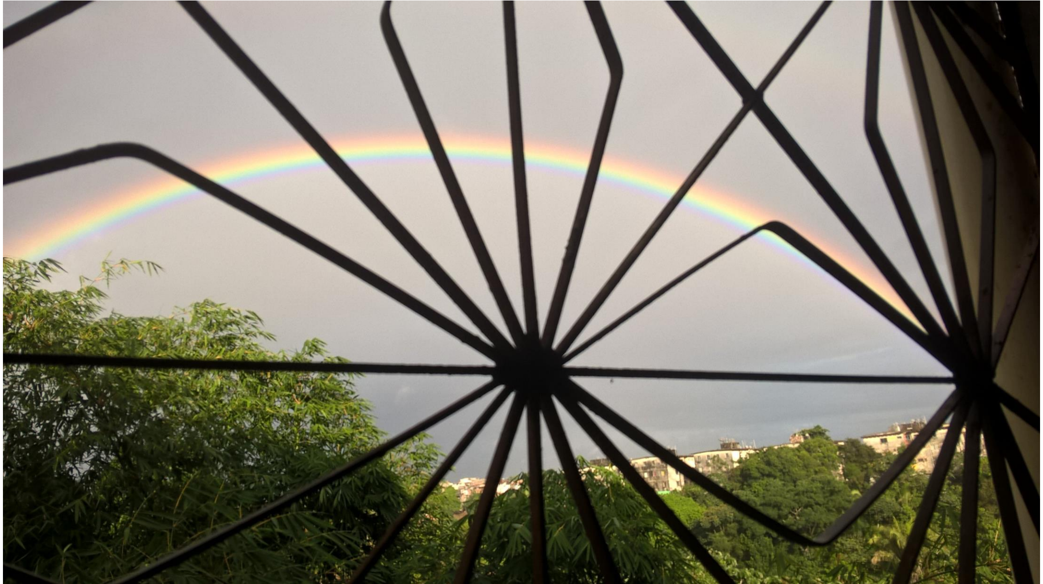
arco-íris atrás das grades